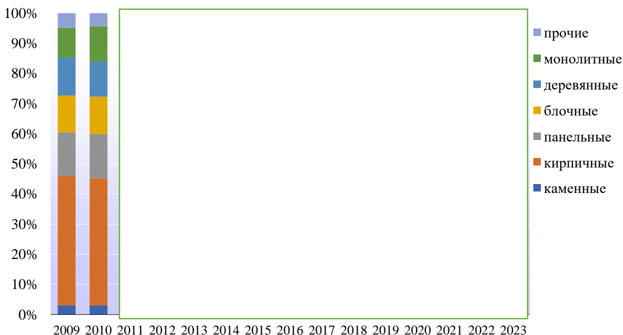
Рис. Структура ввода жилья в зависимости от материала стен в России в 2009-2023 гг.

В каждом регионе есть сложившиеся приоритеты в застройке и отлаженные хозяйственные связи, поэтому приоритеты использования стройматериалов и технологий в строительстве меняются медленно. В общем вводе жилья в среднем по России основное место по-прежнему занимает кирпич, но его доля в строительстве постепенно снижается, уступая место монолитному домостроению.