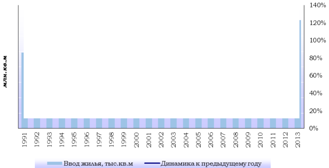
Рис. Ввод жилых площадей в ДФО в 1991-2013 гг.

Темпы роста жилищного строительства в ДФО по итогам 2013 г. ...