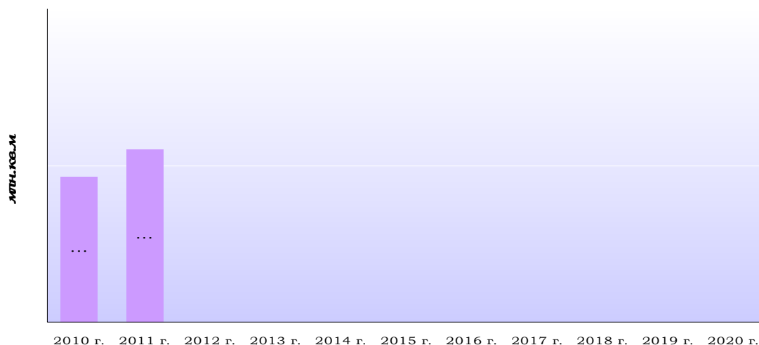
Рис. Прогнозы потребления сборных железобетонных конструкций и изделий в Центральном ФО в 2010-2020 гг.